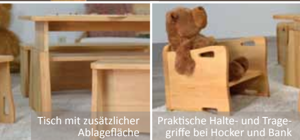
Tisch mit zusätzlicher Ablagefläche