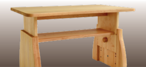
Einfache Steckmechanik für drei unterschiedliche Tischhöhen