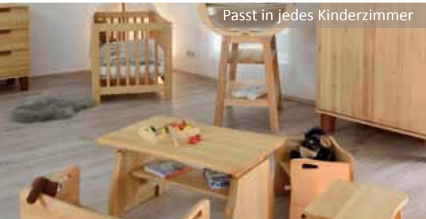
Passt in jedes Kinderzimmer