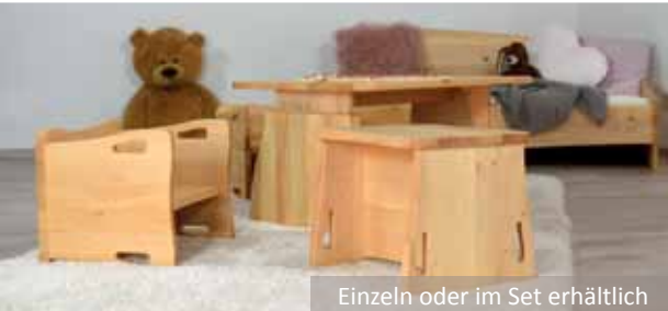
Einzeln oder im Set erhältlich